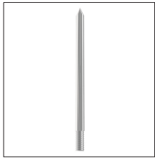
AT-023A Punta captadora ø20 x 400mm inox M20