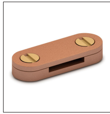
AT-103E Grapa bronce plet 25 x 6mm (DC tape clip)