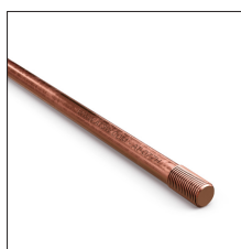
AT-077H Pica ø16 x 1500mm rosca 5/8" cobrizada 254µm