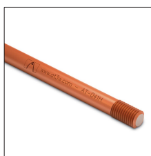
AT-041H Pica ø16 x 2000mm rosca 5/8" cobrizada 254µm