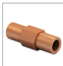
AT-002K Manguito roscado 5/8" (ø16mm)