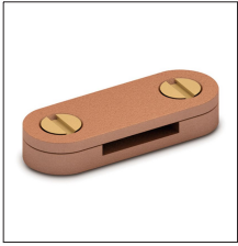
AT-113E Grapa bronce plet 50 x 6mm (DC tape clip)