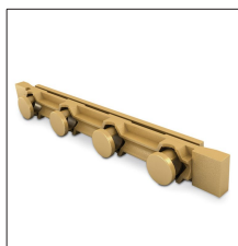
AT-020H Puente comprobación latón para arqueta