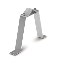
AT-023B Anclaje en U 30cm atornillable (2 soportes) galvanizado