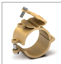
AT-033A Grapa latón cable/plet con soporte mástil 1"