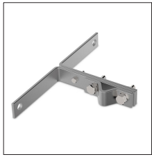
AT-107B Anclaje galv para puntas ø16-34mm