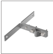
AT-107B Anclaje galv para puntas ø16-34mm