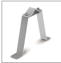
AT-023B Anclaje en U 30cm atornillable (2 soportes) galvanizado