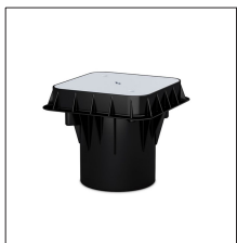
AT-010H Arqueta de polipropileno de 250 x 250 x 250 mm