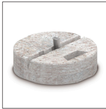
AT-030B Zócalo de hormigón de 17 kg para ø16mm