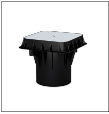
AT-010H Arqueta de polipropileno de 250 x 250 x 250 mm