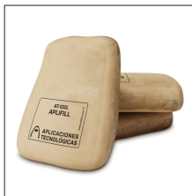
AT-032L APLIFILL 25 kg