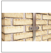
AT-126E Grapa simple de Al para pletina 20x3mm