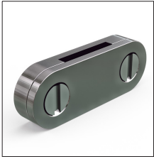
AT-119E Grapa aluminio plet 25 x 6mm (DC tape clip)