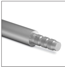
AT-046H Pica galvanizada ø20x1500mm extensible tipo Z.