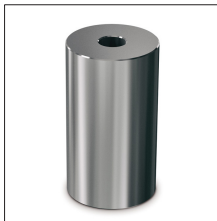
AT-067K Tornillo sufridera picas tipo Z y S galva