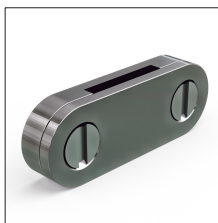
AT-117E Grapa aluminio plet 20 x 3mm (DC tape clip)