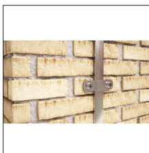
AT-126E Grapa simple de Al para pletina 20x3mm