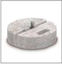
AT-030B Zócalo de hormigón de 17 kg para \varnothing 16 mm