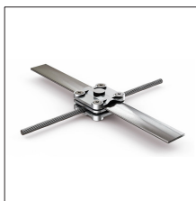
AT-134F Manguito cuadrado aluminio cable ø7-13mm + pletina