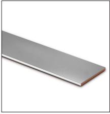
AT-052D Pletina de cobre estañado de 30 x 2mm