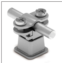
AT-129E Grapa inox para cable \varnothing 6-10mm a pared