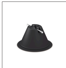
AT-040E Soporte piramidal para cable \varnothing 8mm (vacío)