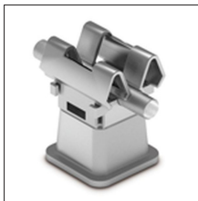
AT-136E Grapa inox fijación rápida \varnothing 10mm