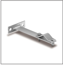
AT-132B Anclaje ligero 30cm (2 soporte) atornillable inoxidable