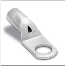
AT-093K Terminal de anillo cobre estañado 50mm 2 M10