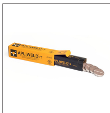
AT-020N Apliweld-T: Tabletas de soldadura (20ud)