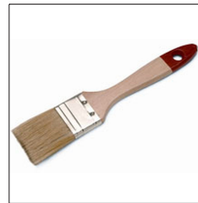
AT-064N Pincel limpieza cámara