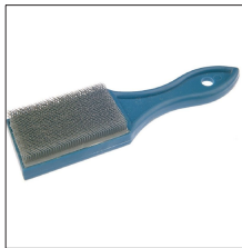
AT-061N Cepillo limpieza conductores