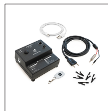
AT-200N Kit Apliweld®-E v.3: Kit de encendido electrónico