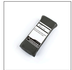
AT-065N Pasta de sellado 0,45kg