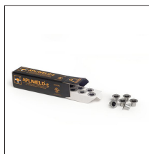
AT-010N Apliweld®-E. Iniciador electrónico 10ud