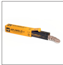
AT-020N Apliweld®-T. 20 tabletas soldadura ø43mm