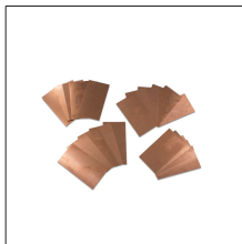
AT-072N Adaptadores de cable