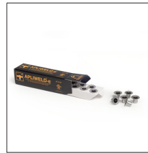
AT-010N Apliweld®-E. Iniciador electrónico 10ud