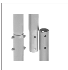
AT-058A Mástil 8m x 1½" galv. Arranque 2"