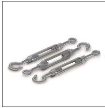
AT-042C Tensor de vientos