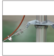
AT-081G Placa de vientos para mástil