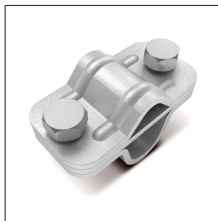
AT-115J Mang descon UNI inox cable a pica