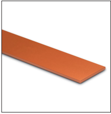
AT-011D Pletina de cobre desnudo de 25 x 3mm