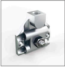
AT-121B Sop.alum punta M10 vertical, cb \varnothing 8mm