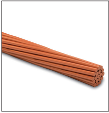
AT-095D Cable de cobre electrolítico trenzado de 95mm 2