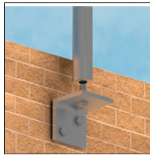
AT-003M Soporte de punta para pared rosca M10