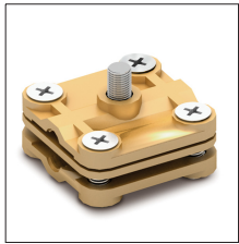
AT-022F Manguito latón tejado plano cable/pletina/punta