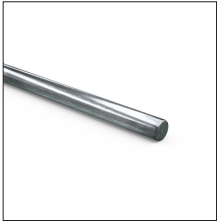
AT-060D Redondo de acero galvanizado macizo ø8mm