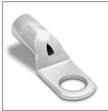
AT-020K Terminal de anillo cobre estañado 35mm 2 M10