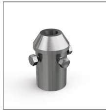
AT-161A Pza adap.inox M16, mast 1½" + cable/plet