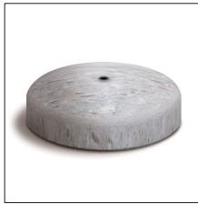
AT-097B Zócalo hormigón rosca M16, 12kg y ø350mm