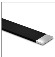
AT-042D Pletina de aluminio de 25 x 3mm con PVC