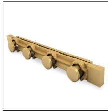
AT-020H Puente comprobación latón para arqueta