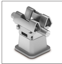
AT-136E Grapa inox fijación rápida ø10mm