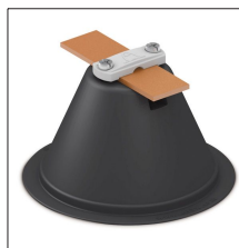
AT-041E Soporte piramidal cable o pletina (vacío)