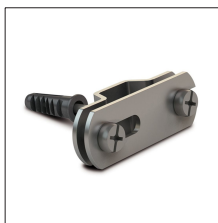
AT-240E Grapa hebilla inox para pletina