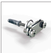
AT-026E Grapa inox pletina con soporte nylon