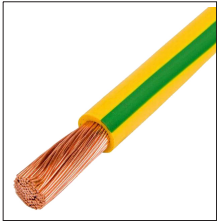
AT-114D Cable de cobre multifilar 50mm 2 con PVC