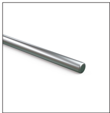
AT-138D Redondo de aleación aluminio (AlMgSi) blando ø8mm