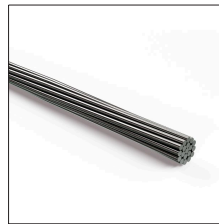
AT-161D Cable de aluminio de 50mm 2