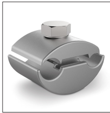
AT-013F Manguito bimetalico para cable 25-150mm 2