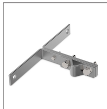
AT-107B Anclaje galv para puntas \phi 16 -34mm