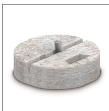
AT-030B Zócalo de hormigón de 17 kg para \phi 16 mm