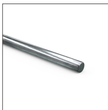
AT-060D Redondo de acero galvanizado macizo ø8mm