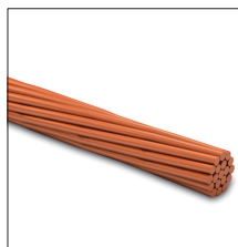
AT-050D Cable de cobre electrolítico trenzado de 50mm 2