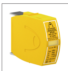
AT-8297 ATSUB Mod. 15-120