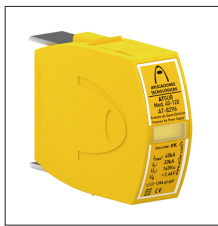
AT-8298 ATSUB Mod. 65-120