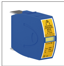
AT-8205 ATSUB Mod. N