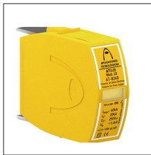
AT-8268 ATSUB Mod. 65