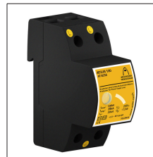
AT-8258 ATSUB 100-400