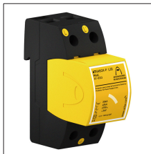
AT-8332 ATSHOCK-P L30-400