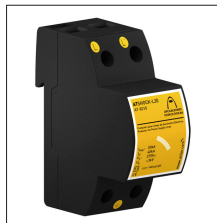
AT-8312 ATSHOCK L30-400