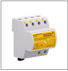
AT-8760 ATCONTROL/R P-T